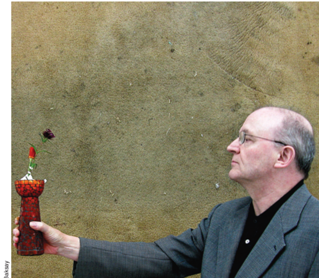
Schürmann cannot be photographed. Ein Fototermin bei Aachens höchster Fotoinstanz ist für den Movie-Gelegenheitsknipser so ähnlich, wie dem Papst die Messe lesen zu müssen

In der nächsten Ausgabe des Kunstforums erscheint ein ausführliches Interview und eine Präsentation von Schürmanns Fotoarbeiten.