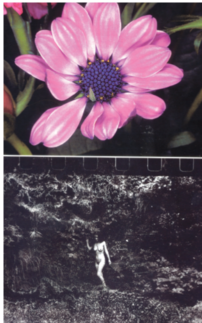
Tugendhafte Objekte der Schamlosigkeit. Nobuyoshi Araki betreibt erotische Ambivalenz bis zum Exzess „Shiyo“ – Buchprojekt 1998

agierenden Familienmitgliedern, die für das Fotoalbum ein schönes Leben vorspielen, bis zu den Dokumenten der Verlogenheit in Presse, Werbung und Politik erzwingt das fotografische Porträt eine sadomasochistische Beziehungssituation. Der Porträtierte ist immer der Idiot, der sich zumindest unbehaglich, wenn nicht gar panisch gelähmt fühlt. Der Fotograf dagegen ist der große Zampano mit sämtlichen Machtmitteln in seiner Hand. Da ist eine Porträtsitzung bei einem Maler oder Zeichner wesentlich humaner.