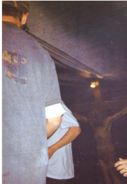
Kontrollierter Zufall- Wolfgang Tillmanns : „Bunker“ 1992

Movie: Ist Humor denn nicht eine Krücke, ein Ersatz für erlebte Emotionalität?